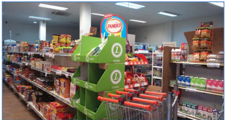
Vista interior del supermercado Covirán