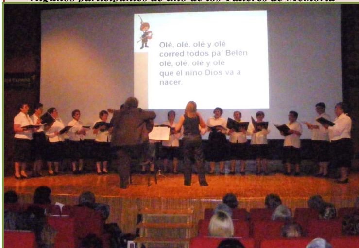
Actuación de la Coral "Fuente la Lagrima" en el Salón de Actos de Caja España

Breve Historia: La Asociación Club de Jubilados Fuente la Lagrima, tiene múltiples actividades a lo largo del año y que realiza con todas sus asociadas/os, una de las más importantes es la Coral "Fuente la Lagrima", a sus componentes les gusta mucho reunirse para cantar, está formado por 23 mujeres y tan solo dos hombres, pero el resultado es magnífico y ellas/os están más que satisfechos con los resultados obtenidos. Han efectuado salidas para cantar a Zamora, en las convivencias como las de Alcañices y Camarzana de Tera, también lo hacen durante los carnavales, en charangas y Navidad, decir que ya se han ganado tres premios a corales.