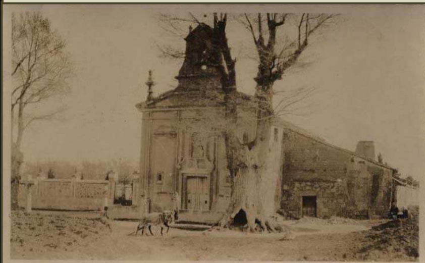
Imagen de aproximadamente 1940, en ella se observa la casa de Belisario "El Enterrador" y los viejos olmos de la entrada.