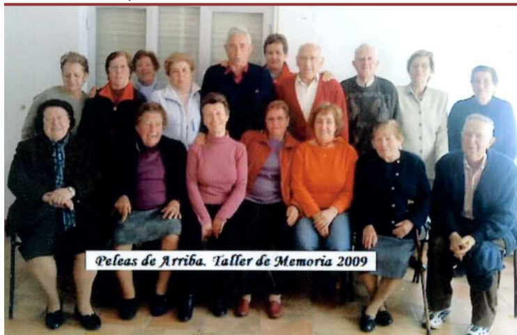
Algunos participantes de uno de los Talleres de Memoria

Actividades previstas: Para el año 2013 - 2014: Viaje a San Sebastián y Bilbao, Concentración Anual de Jubilados en Zamora, talleres de Memoria que se celebran los jueves (por la mañana o por la tarde dependiendo del día), Gimnasia que se lleva a cabo los lunes y los miércoles.