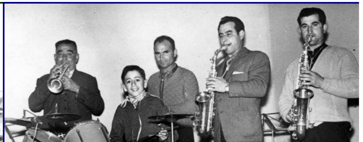
Algunas veces, las actuaciones de la banda eran al aire libre (Imagen derecha) y otras en locales cerrados (imagen izquierda)

También actuaban en toda la comarca de Tierra del Vino en fiestas particulares, locales y en bodas y otras celebraciones.