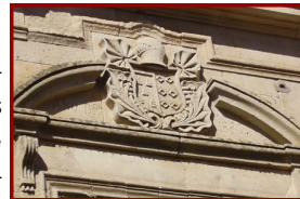
Elementos ornamentales de fachadas neoclásicas

Construidas en sillería de la localidad, son múltiples los ejemplos de estas edificaciones típicas de Tierra del Vino, estas casas neoclásicas cuentan con fachadas de gran belleza y conservadas en buen estado. Algunas de ellas se concentran en la Plaza del Podal, Calle del Oro y Calle Constitución.