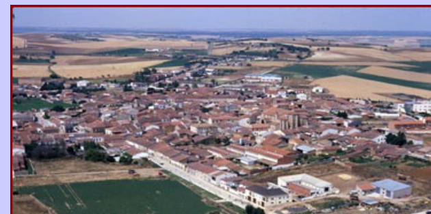
Vista aérea de Corrales del Vino (Zamora)

El municipio de Corrales del Vino comprende tres núcleos de población: