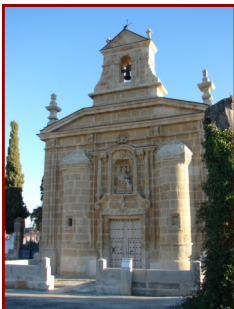
Fachada de la Ermita

Un poco alejada del casco urbano; junto al cementerio se levanta esta Ermita S.XVIII. Es una construcción de sillería arenisca, orientada hacia poniente, con una nave de cinco tramos, cubiertos cuatro de ellos con bóveda de cañón con lunetos, sobre arcos fajones rebajados, mientras que la capilla mayor, a la que se ac-