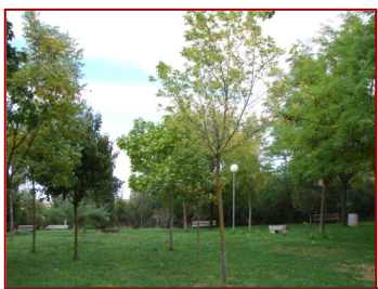
Área recreativa "El Plantío"

Situado a unos 1.500 metros de Corrales, este extenso parque de suave césped está repoblado con una gran variedad de árboles que le aportan una belleza