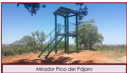
Mirador Pico del Pájaro

La parcela se sitúa en el término de Peleas de Arriba con una superficie de 56 hectáreas. En ella se han hecho trabajos de desbroce, poda de árboles adultos, limpieza de jara, repoblación con especies autóctonas, cortafuegos, así como de un sendero de 5km de longitud debidamente señalado, y se ha acondicionado los caminos que dan acceso al quejigal. Además hay un puesto de observación en el teso El Pico el Pájaro (905 m). Este proyecto fue ganador del premio Fuentes Claras para la sostenibilidad de Municipios Pequeños de CyL, por se un buen ejemplo de una actuación correcta para la protección de espacios naturales de alto valor ecológico.