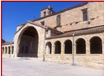
Iglesia Sta. M ra Magdalena

Situada en la Plaza del Cabildo y de grandes dimensiones. En su obra exterior : la construcción es de sillería isódoma arenisca de tres naves desiguales en cuanto a su anchura con la torre, construida con sillares a