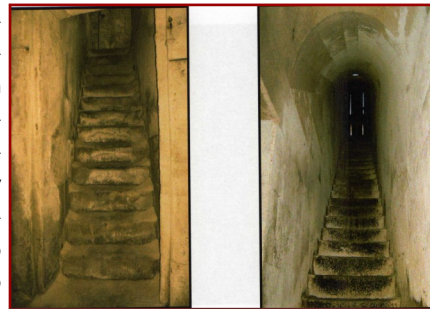
Entrada a bodegas del municipio

Entre los tres núcleos de población se conservan un gran número de bodegas que, en la mayoría de los casos, han perdido su ocupación tradicional. Es difícil determinar el origen de las mismas, algunas datan de hace tan sólo unas décadas, pero la mayoría son muy antiguas. En Corrales del Vino existe un único patrón común y