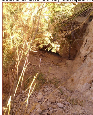
Boca casi tapada del túnel

Por lo que nos cuenta Eduardo, se venían cobrando de jornal aproximadamente unas 14 ó 15 pesetas al día y que esto sucedía sobre el año 1945, aunque no puede concretar más.