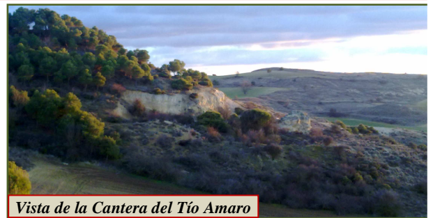
Vista de la Cantera del Tío Amaro

La cantera fue propiedad de la familia hasta la concentración parcelaria en la que todos los baldíos pasaron a manos del Ayuntamiento, cuando este paso sus propiedades a la masa común de la concentración para que mejorasen las tierras a concentrar, quedando el Ayuntamiento de Corrales del Vino sin tierras de valor siendo propietario de todas o casi todas las laderas del valle, en las que apenas algunos pinos pueden progresar. Anteriormente de esta cantera también salió la piedra para el claustro del Seminario de San Atilano en Zamora, y seguramente para la construcción de muchas de las fachadas para las casas de Corrales del Vino y de otras localidades próximas.