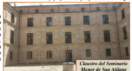
Claustro del Seminario Menor de San Atilano